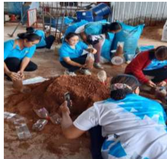
เรียนรู้เรื่องการเพาะเห็ดนางฟ้า เพื่อส่งเสริมการสร้างรายได้ ลดรายจ่าย