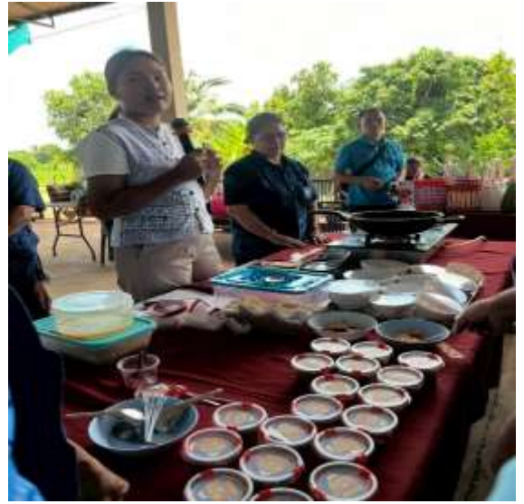
เรียนรู้เรื่องการทำน้ำพริกปลานิล