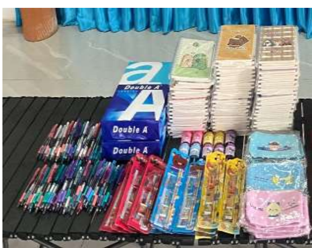
กิจกรรม จัดนิทรรศการให้ความรู้เรื่องโรคเอดส์และตอบปัญหาชิงรางวัล