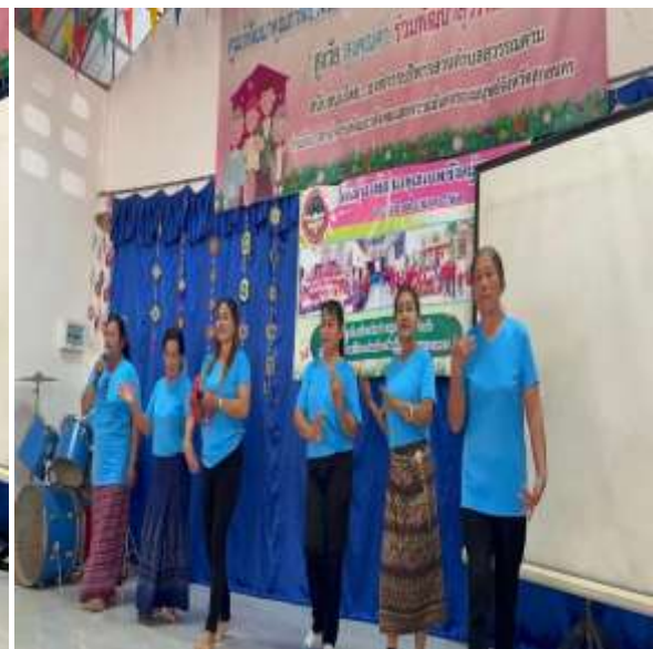
กิจกรรมส่งเสริมสุขภาพกาย สบายสุขภาพจิต