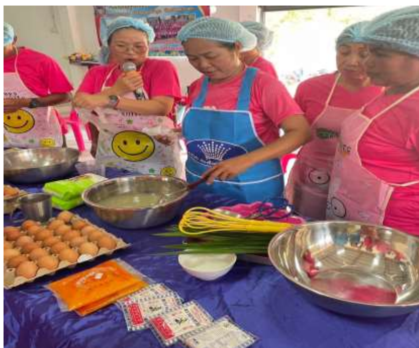
วิทยากรให้ความรู้เกี่ยวกับการฝึกอาชีพเสริมเพิ่มรายได้แก่ผู้สูงอายุและครอบครัว