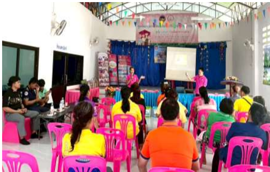
กองสวัสดิการสังคม ให้ความรู้เกี่ยวกับการบริหารจัดการขยะมูลฝอยชุมชน แนวทางการดำเนินงานตามแผนรณรงค์ “แยกก่อนทิ้ง” การจัดการขยะภายใต้หลักการ ๓ ช.