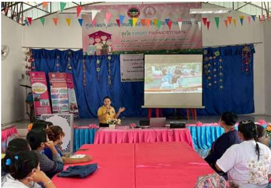
กองสวัสดิการสังคม แนะนำโครงการและการประกอบอาชีพเสริมเพิ่มรายได้ในยุคปัจจุบัน