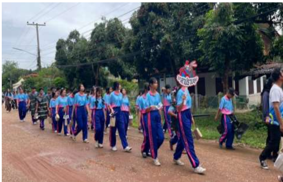
กิจกรรมเดินรณรงค์ให้ความรู้และสร้างจิตสำนึกการป้องกันโรคไข้เลือดออก กำจัดแหล่งเพาะพันธุ์ลูกน้ำยุงลาย