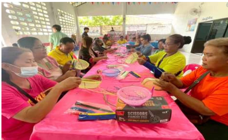
วิทยากร ศูนย์ขับเคลื่อนและเรียนรู้การเปลี่ยนแปลงสภาพภูมิอากาศภาคป่าไม้ ระดับพื้นที่ (จังหวัดสกลนคร) ให้ความรู้การให้ความรู้ การแปรรูปขยะ ฝึกทักษะการแปรรูปขยะ