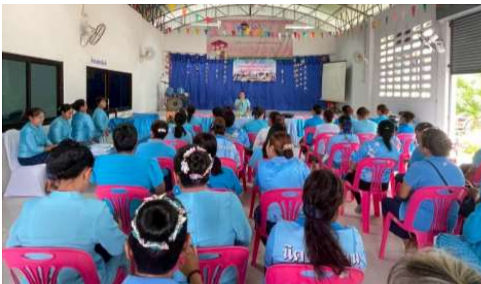
กองสวัสดิการสังคม แนะนำโครงการและกิจกรรมสันทนาการ