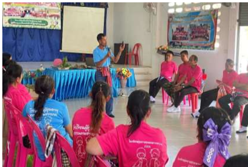
วิทยากรปราชญ์ชุมชน ให้ความรู้เรื่องการดูแลสุขภาพด้วยสมุนไพรพื้นบ้าน