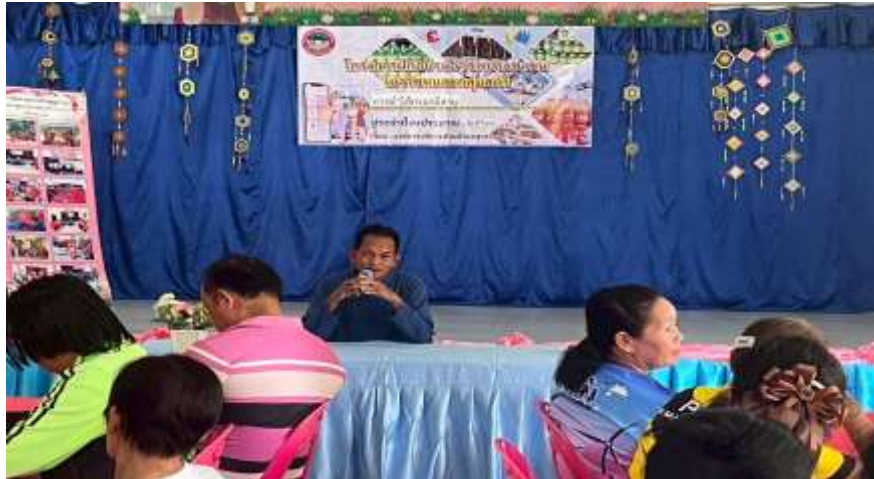
ท่านนายก ประธานเปิดโครงการ