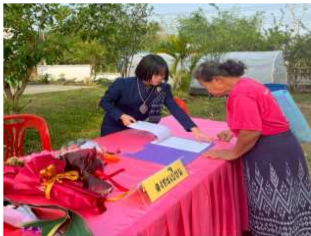
ลงทะเบียนเข้าร่วมโครงการ ชมนิทรรศการกิจกรรมโรงเรียนผู้สูงอายุ รุ่นที่ ๗