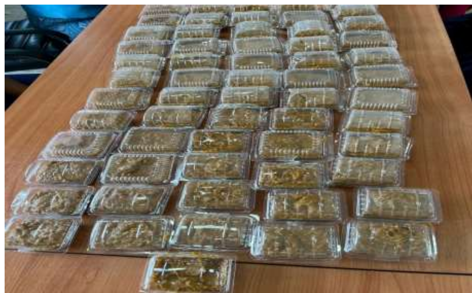
ฝึกทักษะการทำเครื่องสำอางดูแลสุขภาพผิว