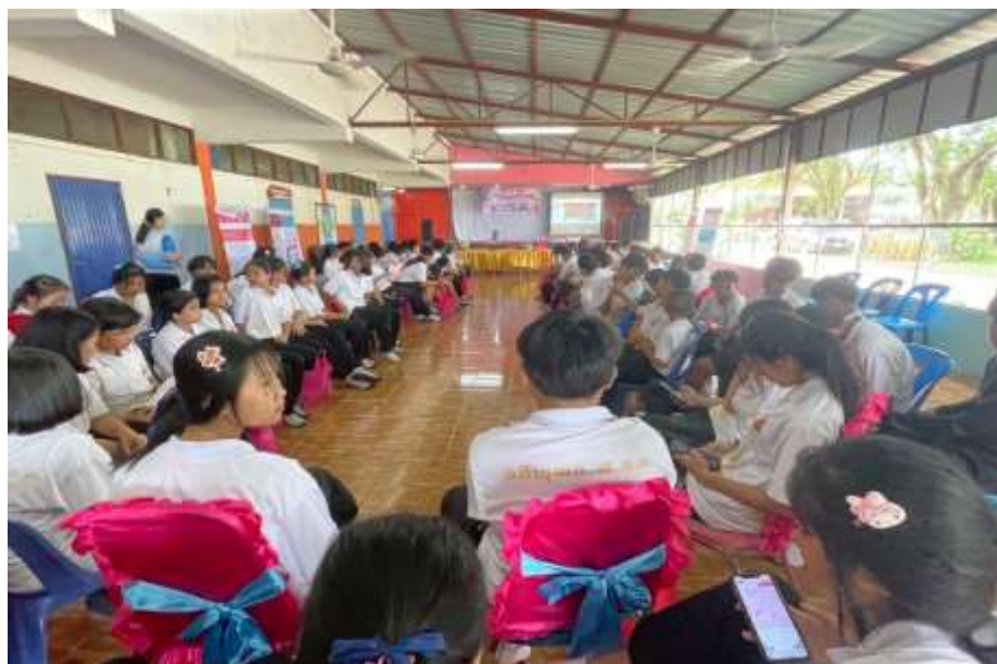
วิทยากรจาก โรงพยาบาลส่งเสริมสุขภาพตำบลบ้านโนนสุวรรณให้ความรู้แก่ผู้เข้าร่วมโครงการ