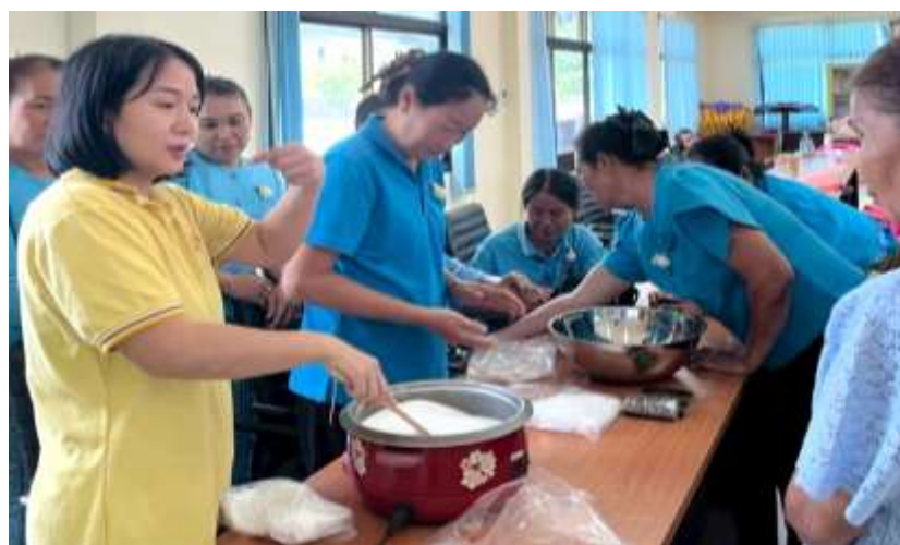
วิทยากร รพ.สต.บ้านโนนสุวรรณ ให้ความรู้เรื่องการให้ความรู้การดูแลสุขภาพสตรีด้วยแพทย์แผนไทย การใช้เครื่องสำอางเพื่อสุขภาพผิวพรรณสตรี