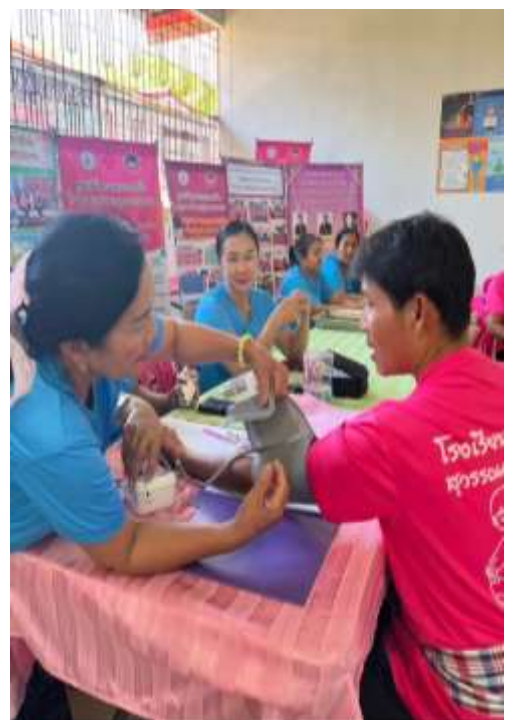
ตรวจสุขภาพเบื้องต้น