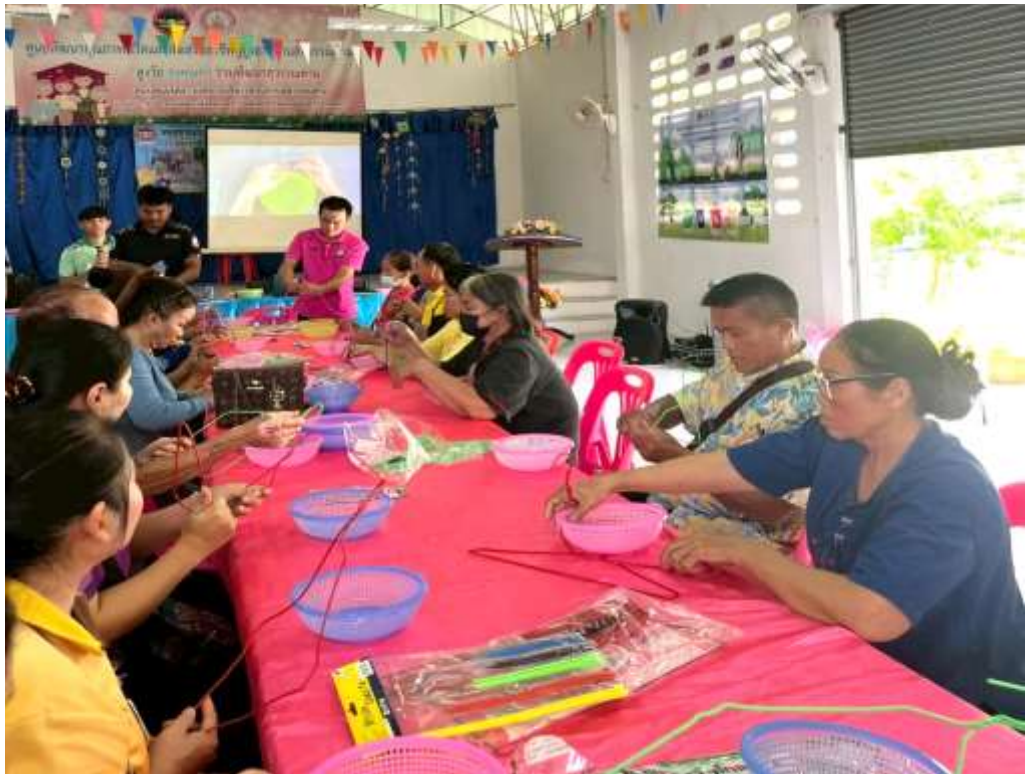
วิทยากร ศูนย์ขับเคลื่อนและเรียนรู้การเปลี่ยนแปลงสภาพภูมิอากาศภาคป่าไม้ ระดับพื้นที่ (จังหวัดสกลนคร) ให้ความรู้การให้ความรู้ การแปรรูปขยะ ฝึกทักษะการแปรรูปขยะ