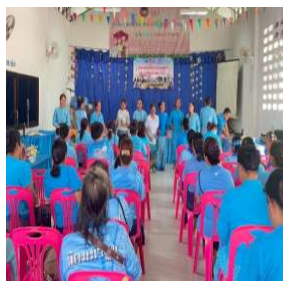
กิจกรรมเรื่องเล่าการดูแลสุขภาพ ประสบการณ์การป่วยด้วยโรคต่างๆของสตรี กิจกรรมออกกำลังกาย นันทนาการ