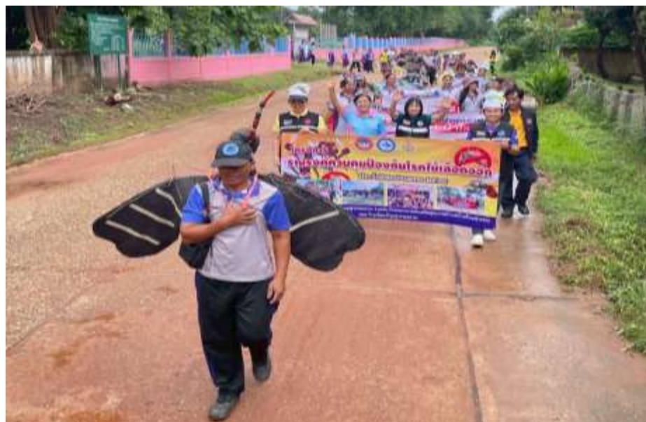
กิจกรรมเดินรณรงค์ให้ความรู้และสร้างจิตสำนึกการป้องกันโรคไข้เลือดออก กำจัดแหล่งเพาะพันธุ์ลูกน้ำยุงลาย