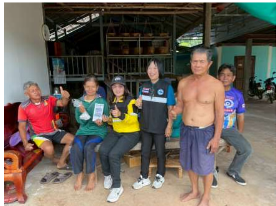
กิจกรรมเดินรณรงค์ให้ความรู้และสร้างจิตสำนึกการป้องกันโรคไข้เลือดออก กำจัดแหล่งเพาะพันธุ์ลูกน้ำยุงลาย