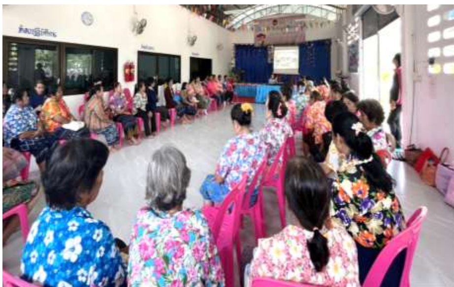
วิทยากร นิคมสร้างตนเองลำน้ำอูน ให้ความรู้เรื่อง อาชีพผู้สูงอายุ งานอดิเรกผู้สูงอายุ ทำอย่างไรให้ได้เงิน