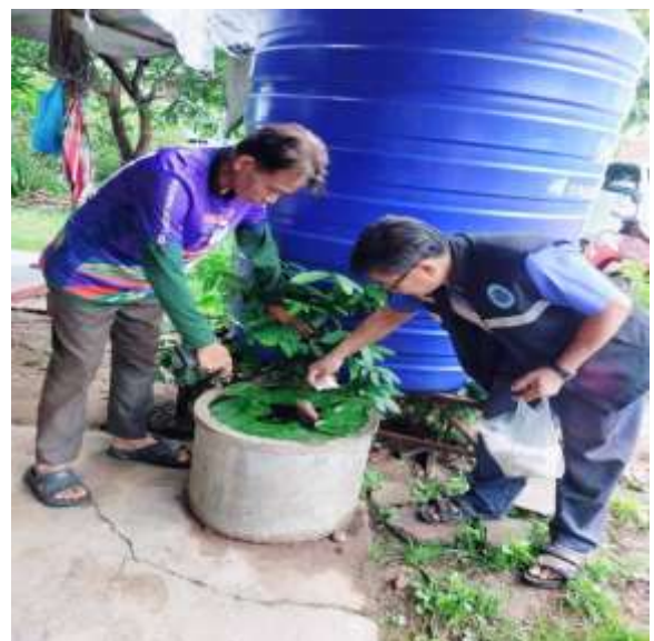
ร่วมกันกำจัดแหล่งเพาะพันธุ์ลูกน้ำยุงลาย ทั้ง ๗ หมู่บ้าน