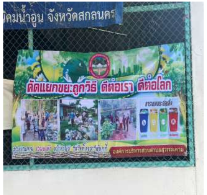
ติดป้ายรณรงค์การคัดแยกขยะในชุมชน ที่สาธารณะ