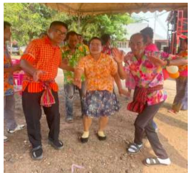
กิจกรรมนันทนาการผู้สูงอายุ รำวงสงกรานต์ รำวงย้อนยุค