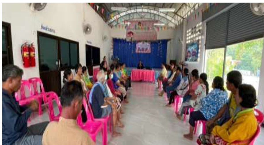
ท่านนายก ประธานเปิดพิธี