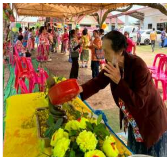
พิธีสงฆ์และรดน้ำดำหัวขอพรผู้สูงอายุ เนื่องในวันผู้สูงอายุ เทศกาลสงกรานต์