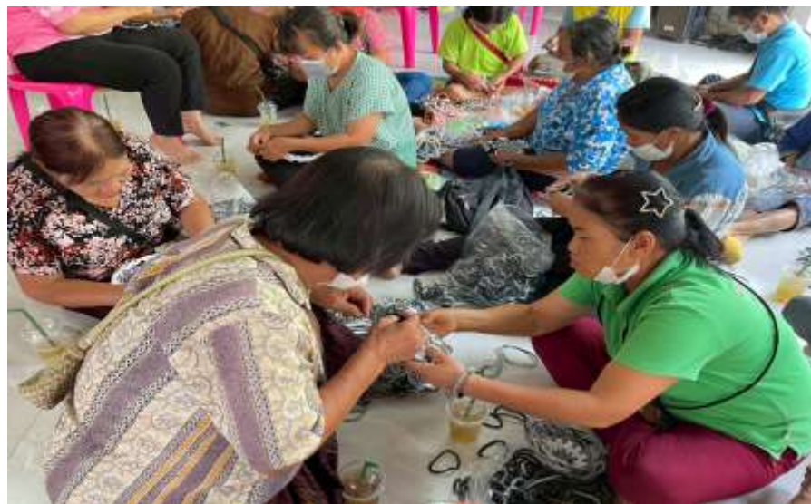
วิทยากร ประธานกลุ่มพรมเช็ดเท้าตำบลสุวรรณคาม ให้ความรู้การส่งเสริมอาชีพแก่คนพิการและครอบครัว เพื่อ เพิ่มรายได้ ลดรายจ่ายในครัวเรือน และฝึกทักษะการทำพรมเช็ดเท้า