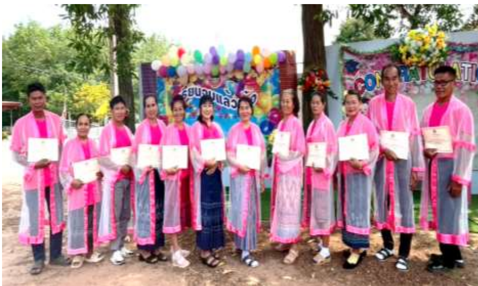
พิธีมอบวุฒิบัตรแก่ผู้เข้าร่วมโครงการ