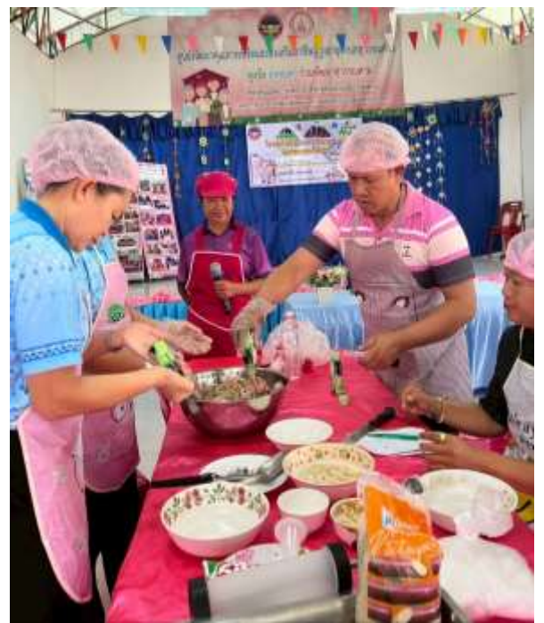
ฝึกทักษะการทำไส้กรอกอีสาน