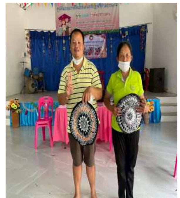
ฝึกทักษะการทำพรมเช็ดเท้า