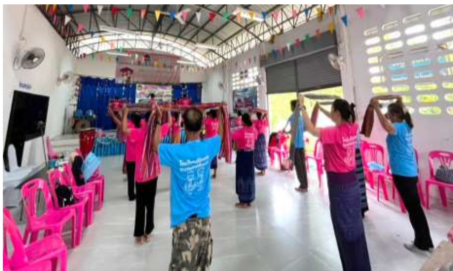
- กิจกรรมเสริมสร้าง สุขภาพกาย สบายสุขภาพจิต ผู้สูงอายุ