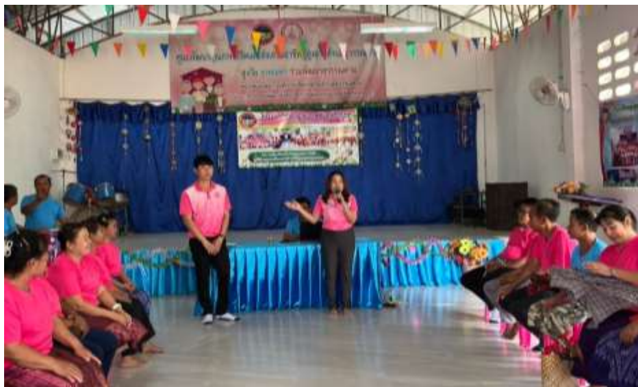
กองสวัสดิการสังคม และเจ้าหน้าที่นิคมสร้างตนเองลำน้ำอูน ให้ความรู้เรื่องการสร้างความมั่นคงทางเศรษฐกิจผู้สูงอายุ เพื่อลดรายจ่ายเพิ่มรายได้ในครัวเรือน