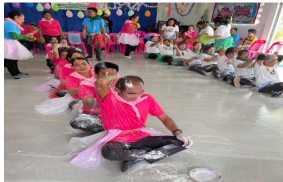
กิจกรรมกีฬาผู้สูงอายุ พัฒนาสุขภาพกาย สุขภาพจิต