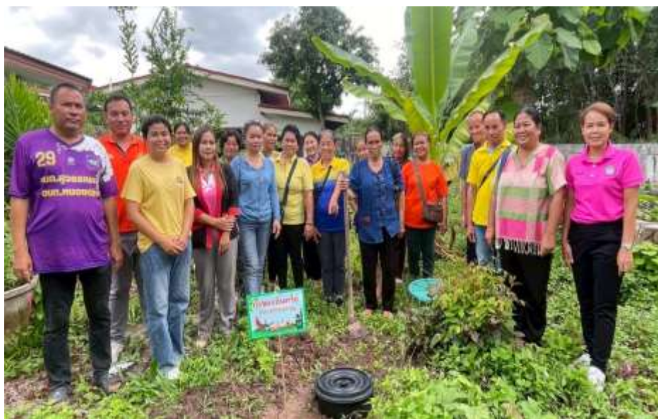
การให้ความรู้เรื่องการทำถังขยะเปียกลดโลกร้อนและสาธิตการทำถังขยะเปียก