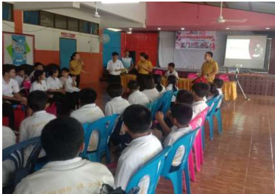
กิจกรรมนันทนาการ