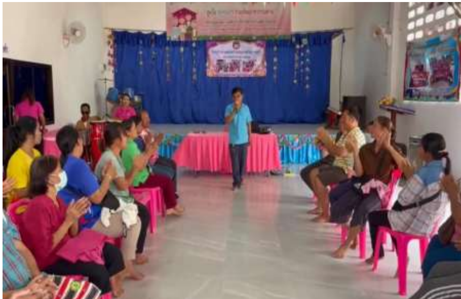
กิจกรรมนันทนาการ