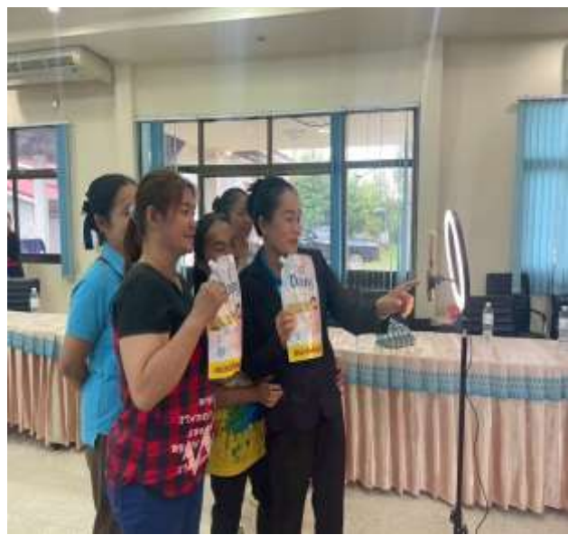
ฝึกทักษะการขายสินค้าออนไลน์ การปิดตะกร้าสินค้าในแอปสร้างรายได้