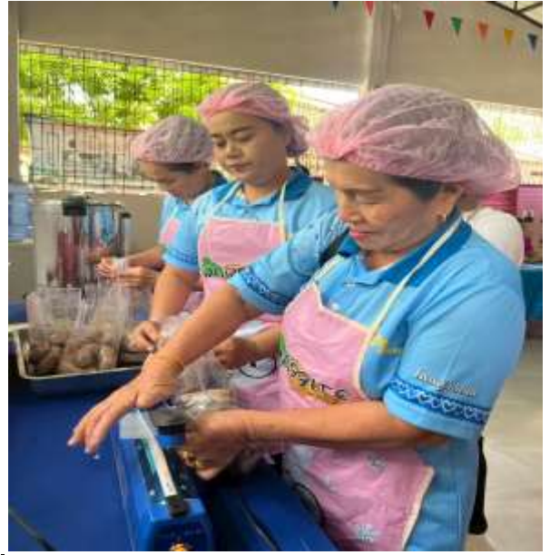
ฝึกทักษะการบรรจุหีบห่อ