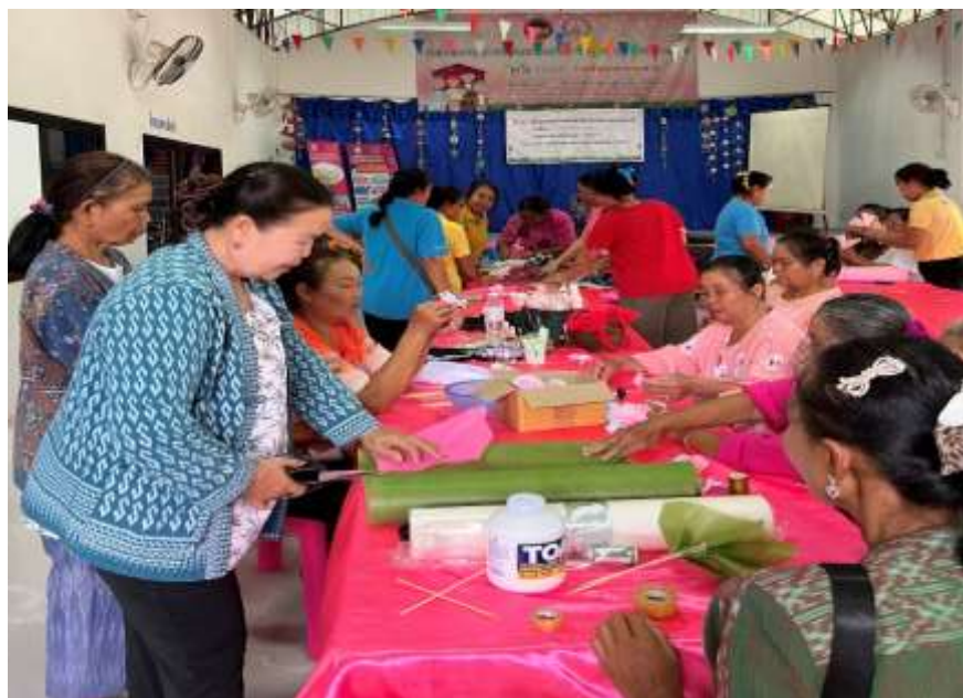
ฝึกทักษะการทำดอกไม้ การทำพวงหรีดแบบต่างๆ