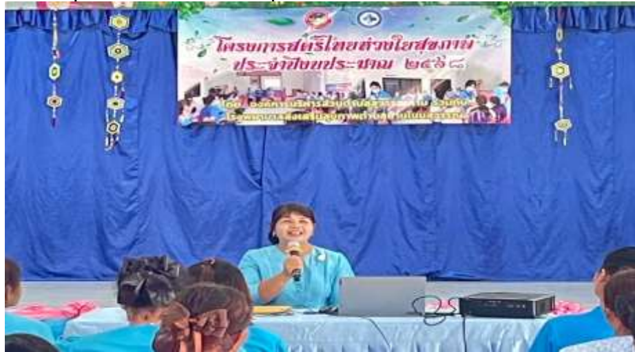
ท่านรองนายก อบต.สุวรรณคาม ประธานเปิดโครงการ