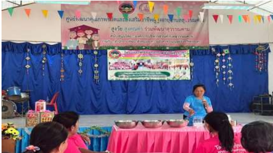
วิทยากร คณะกรรมการ ศพอส.ให้ความรู้เกี่ยวกับการฝึกอาชีพทำน้ำยาปรับผ้านุ่ม