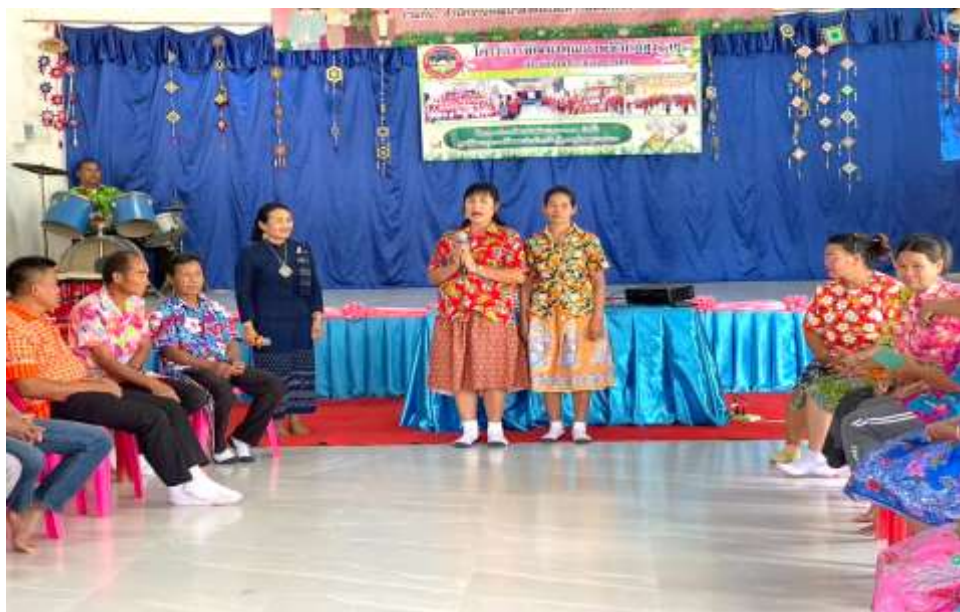
กองสวัสดิการสังคม ให้ความรู้เรื่องระเบียบกฎหมายเกี่ยวกับเบี้ยยังชีพและสวัสดิการผู้สูงอายุ