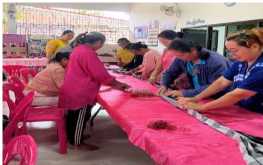
ฝึกทักษะการทำดอกไม้ การทำพวงหรีดแบบต่างๆ