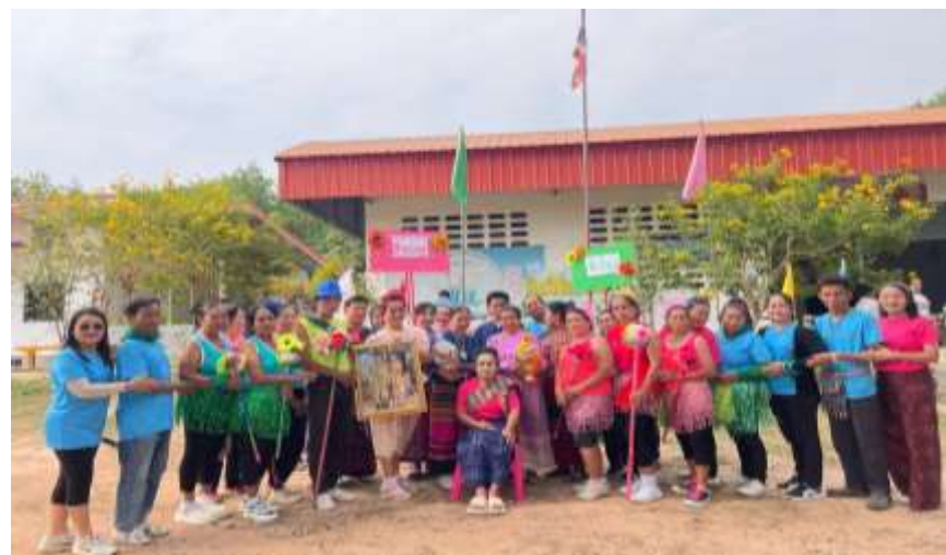
กิจกรรมกีฬาผู้สูงอายุ พัฒนาสุขภาพกาย สุขภาพจิต