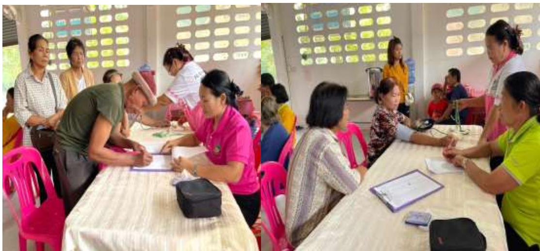
ตรวจคัดกรองสุขภาพคนพิการและผู้เข้าร่วมโครงการ