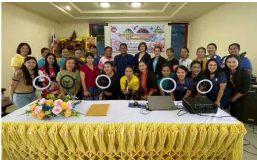
ท่านนายก อบต.สุวรรณคาม ประธานเปิดโครงการ