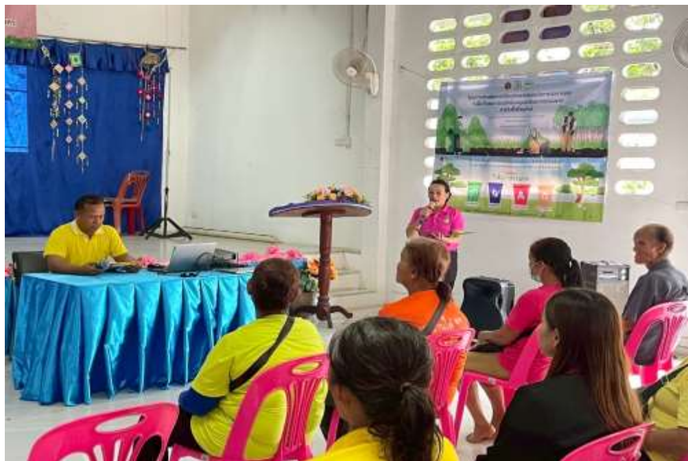
ประธานธนาคารขยะ ประธานเปิดโครงการ