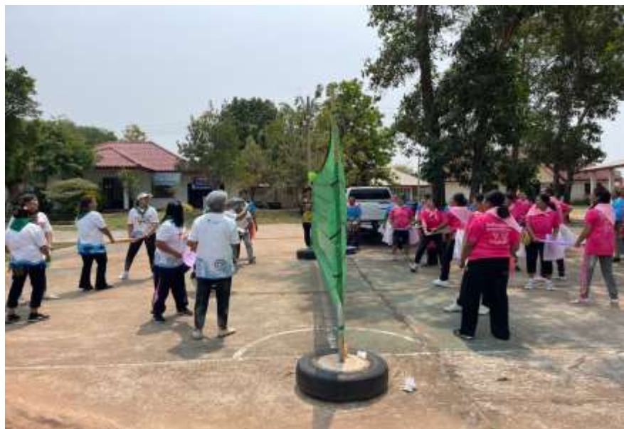
กิจกรรมกีฬาผู้สูงอายุ พัฒนาสุขภาพกาย สุขภาพจิต