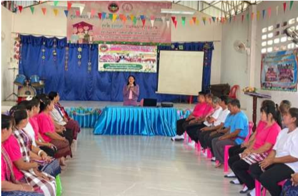
หัวหน้าสำนักปลัด ประธานเปิดโครงการ