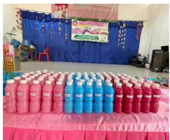
ฝึกทักษะอาชีพการทำน้ำยาปรับผ้านุ่ม ทุกรายจ่าย เพิ่มรายได้ ผู้สูงอายุและครอบครัว