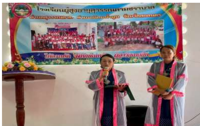
พิธีมอบวุฒิบัตรแก่ผู้เข้าร่วมโครงการ