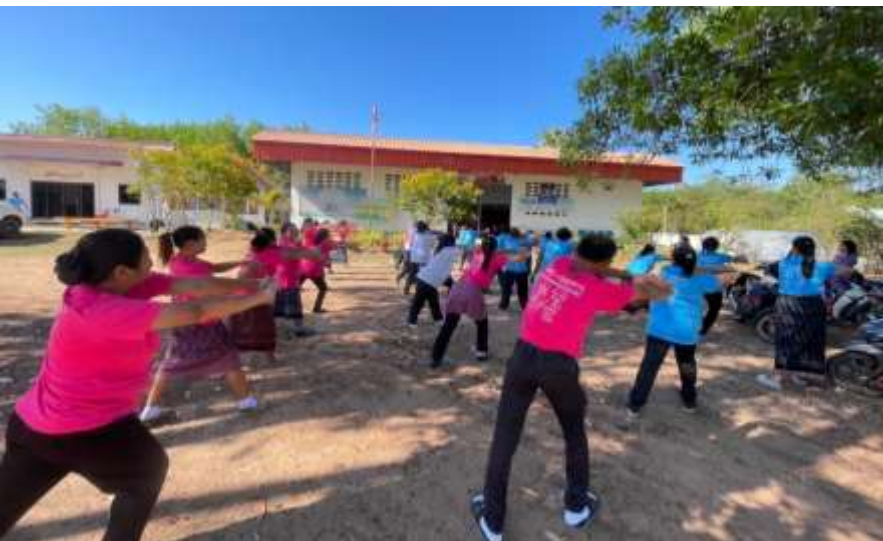
กิจกรรม เคารพธงชาติ สวดมนต์ไหว้พระ ออกกำลังกายหน้าเสาธง