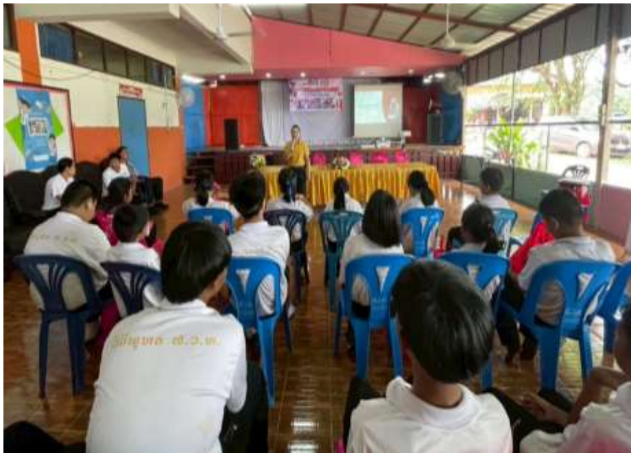
กองสวัสดิการสังคม แนะนำโครงการ