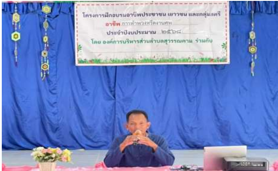
นายกองค์การบริหารส่วนตำบลสุวรรณคาม ประธานเปิดโครงการ