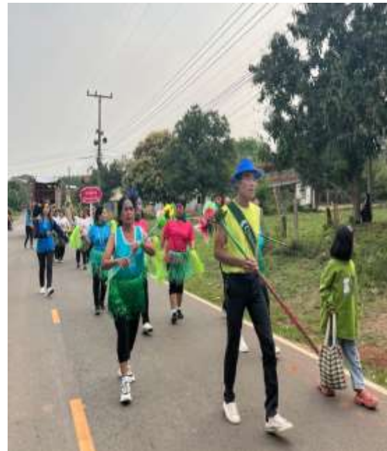
กิจกรรมกีฬาสำหรับผู้สูงอายุ พัฒนาสุขภาพกาย สุขภาพจิต