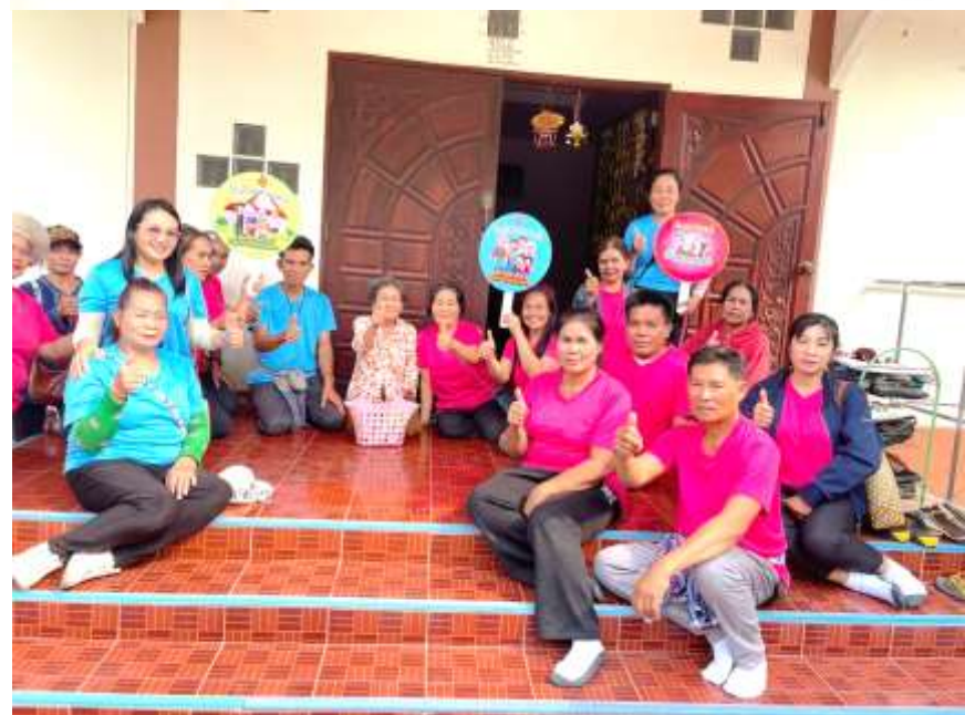
กิจกรรมเยี่ยมบ้านผู้สูงอายุ