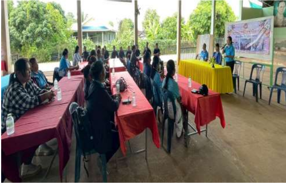
ผู้อำนวยการกองสวัสดิการสังคม ให้ความรู้เรื่องบทบาทสตรีในการพัฒนาชุมชน