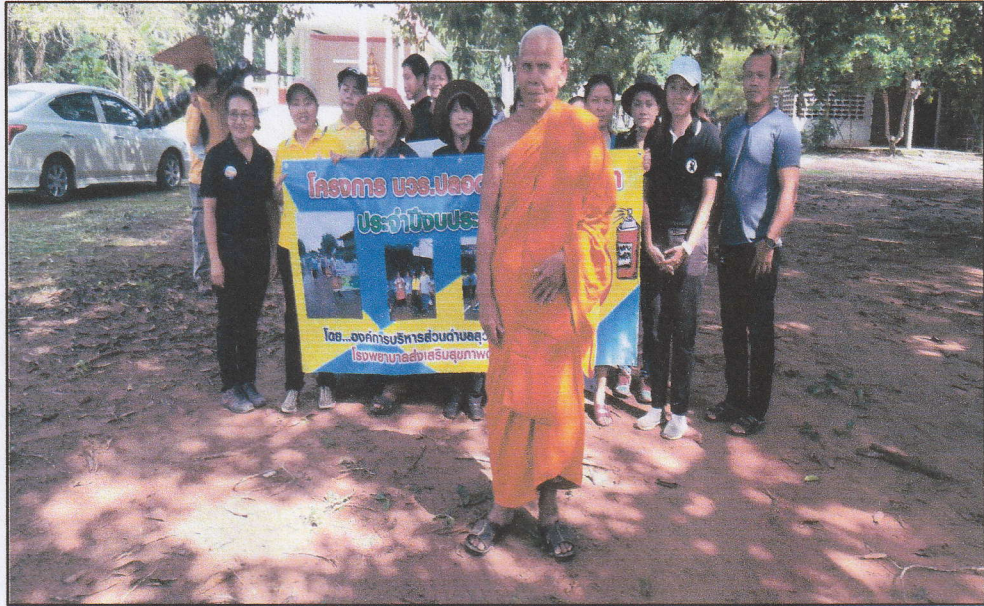
๑๒๒ (๗) โครงการ บวร.ปลอดภัยเลือดออก